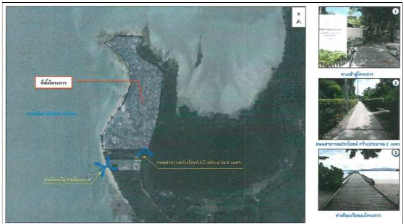
รูปที่ 2.1 พื้นที่ตั้งโครงการ